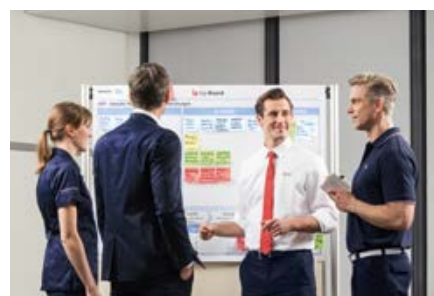
Effizient und wertschöpfend: Fachbereichsübergreifende Zusammenarbeit für kontinuierliche Prozessoptimierung