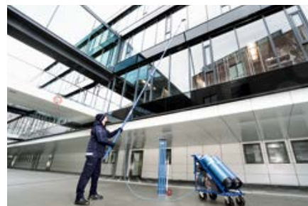
Reduzierte Kosten, umweltfreundliche Methode: Modernes Osmoseverfahren für erstklassige Reinigung bis 18 Meter Höhe